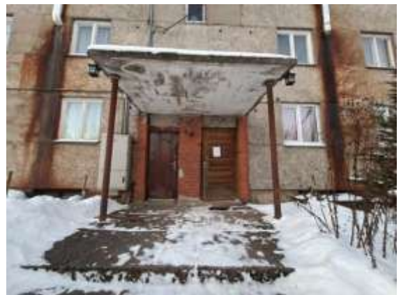
leeja kāpņu telpā