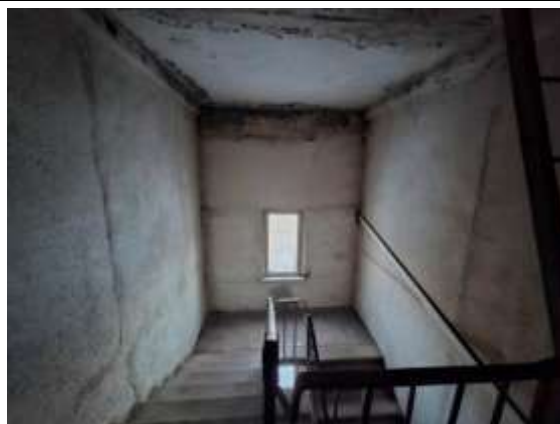
3.stāva kāpņu telpa