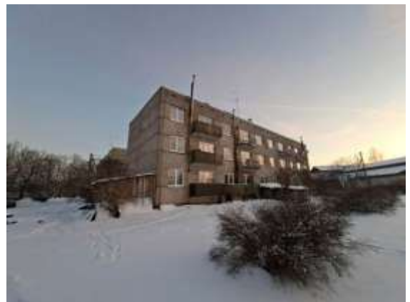
Dzīvojamā māja Skolas ielā 2A