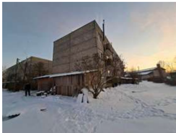
Dzīvojamā māja Skolas ielā 2A