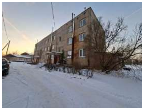
Dzīvojamā māja Skolas ielā 2A